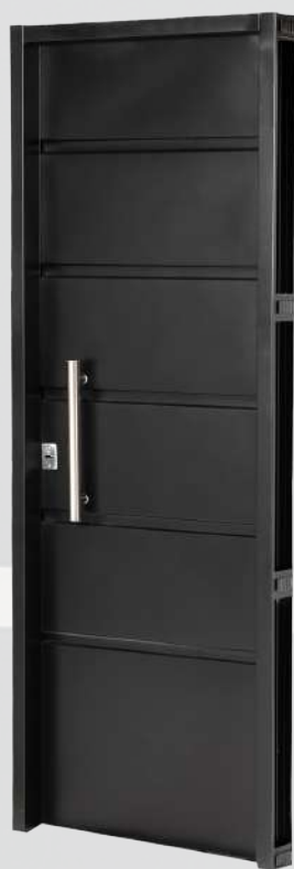
Neg 11.310 DER 70 cm